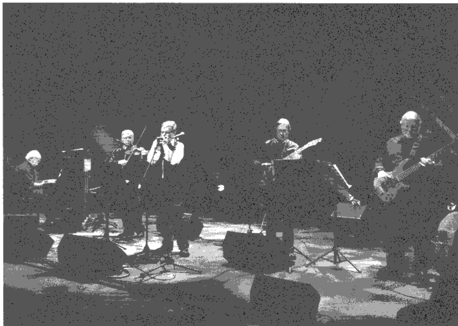
Concert de Gala International à Homécourt

En 1999, il fonde HARMONICA ORCHESTRA DE LORRAINE dont il est actuellement le Président d'Honneur et le Directeur Musical . Il est également Vice-Président d'Harmonicas de France Fédération .