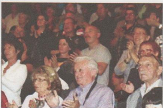
Plus de 400 personnes avaient investi Pablo-Picasso samedi soir.