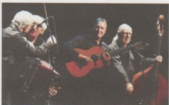
Le Swing minor quartet, des musiciens exceptionnels.

La présentation était assurée par Didier Olhmer, qui a su, toujours avec le même talent, trouver la formule pour annoncer chacun des musiciens. Pour le final, tous les artistes qui ont fait vibrer les spectateurs sont revenus sur scène, entourant le maître. Une véritable ovation qui n'en finissait plus leur a été faite. La grande famille de l'harmonica ajoute à son compte, une fois encore, une soirée mémorable.